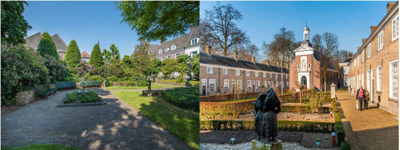
Catharinastraat 28C - Breda Eerste Verdieping